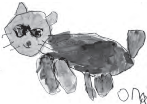
Рисунок Оли Р.