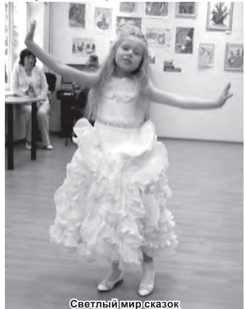
Светлый мир сказок

• 30 марта, 14:00 Библиотека пос. Прибрежный «Теремок». Театральная гостиная.