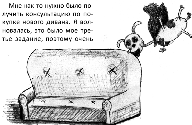
Рисунок Анжелики Кубряк