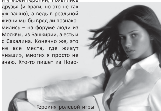
Героиня ролевой игры

С жалостью смотрю на маленьких молоденьких девочек и мальчиков. Далеко ходить не буду: излюбленное место многих калининградцев – торговый центр «Европа». Там весь кладезь дешевого пафоса и перенакрашенных самовлюбленных дурочек, которые своими боевым раскрасом, многочисленными сумками, шарфами, ремнями подделанных модных брендов и в обтягивающих леггинсах с короткими майками пугают меня.