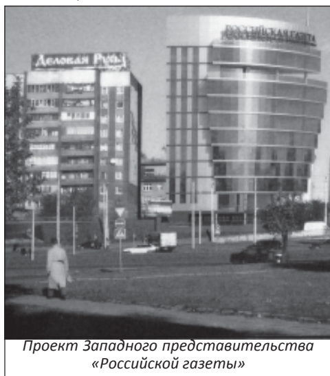
Проект Западного представительства «Российской газеты»

Но это я рассказал лишь о том, что могло быть, но думаю всем намного интересней узнать, как наш город может измениться в будущем. Уже имеются проекты кардинального изменения центра, по восстановлению замка в изначальном виде и городов Альтштад и Кнайпхоф. На месте «зелёной зоны» между Преголей и Московским проспектом может появиться средневековый квартал, как в Праге или Кракове, а на острове Канта – дома, повторяющие историческую застройку. Но это ещё не самый