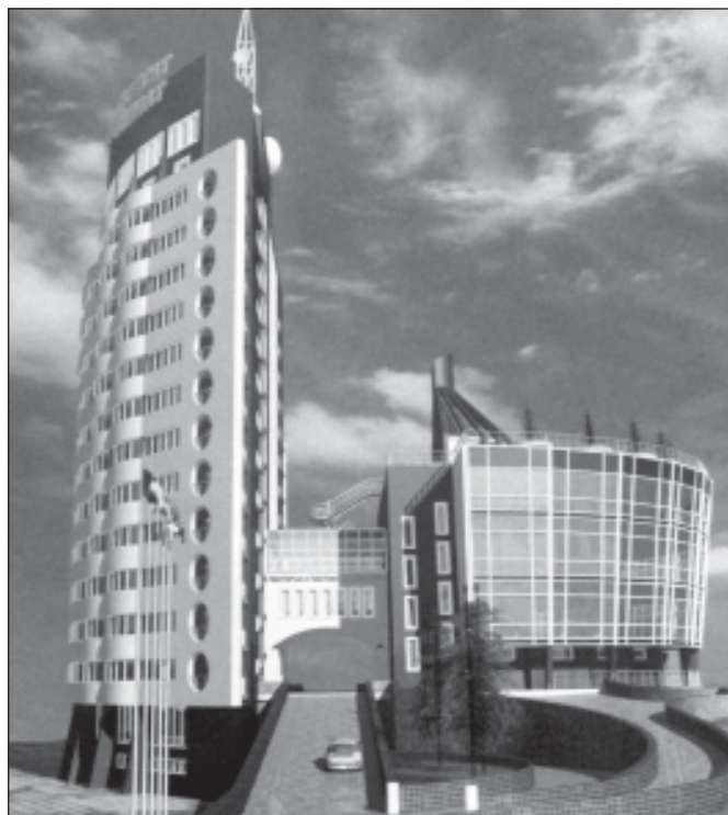
Проект гостиницы в Балтийске

необычный из существующих проектов. На улице Портовой может вырасти квартал-крепость, двухъярусный мост – исчезнуть, а на его месте встать высоченный автомобильная эстакада. Вполне возможно, напротив гостиницы «Калининград» появится «зелёный